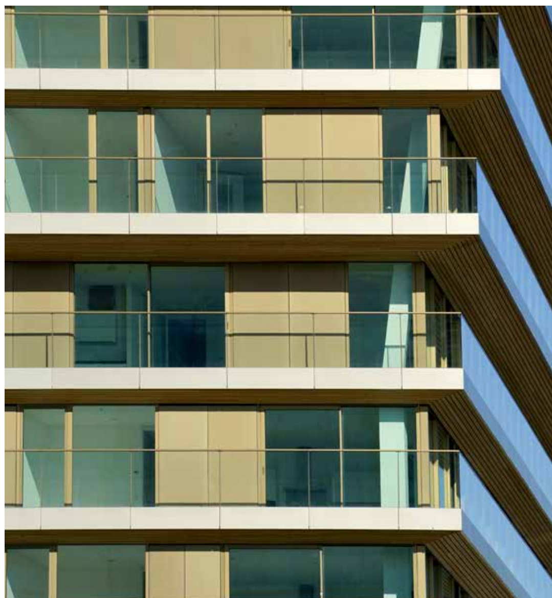
De vraag naar kleur geanodiseerd aluminium is sterk toegenomen. Een mooi voorbeeld is de balkonbeplating en de profielen in de brons-tinten Colinal C31 en C33 voor het Terraced Tower project (Rotterdam).

“Bij normale buitentoepassingen met voldoende laagdikte van 20 of 25 µm én mits de laag goed onderhouden wordt, is twintig jaar garantie absoluut geen probleem. Daarnaast is geanodiseerd aluminium uitstekend te recyclen en draagt de toepassing bij in de transitie naar de circulaire economie”, gaat de directeur verder. “We bedienen diverse klantengroepen. Zo zijn we een ‘preferred supplier’ bij diverse extrusiebedrijven. We werken ook nauw samen met gevelbouwers en systeemhuizen en richten ons op zowel de binnen- als buitenarchitectuur. Daarnaast ligt er een grote focus op niche-producten, bijvoorbeeld als het gaat om gelaste constructies, inwendig geanodiseerde cilinders, zware