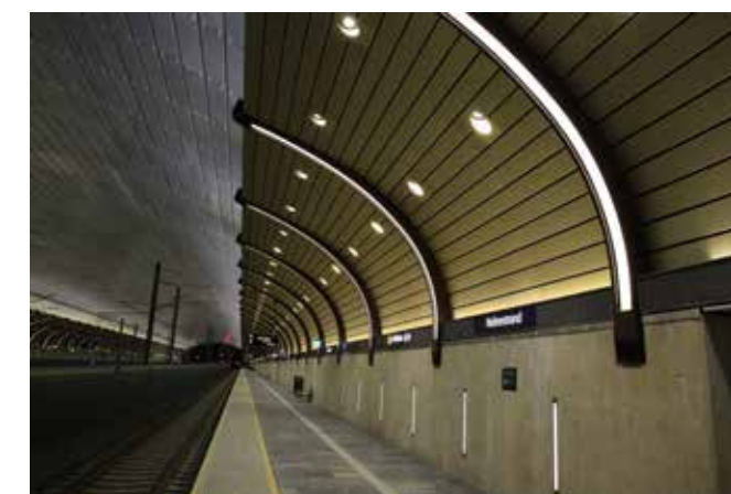
In dit ondergrondse Holmestrand station bij Oslo (Noorwegen) komen de geperforeerde cassettes in Champagne A3 en Colinal C4 mooi tot hun recht.